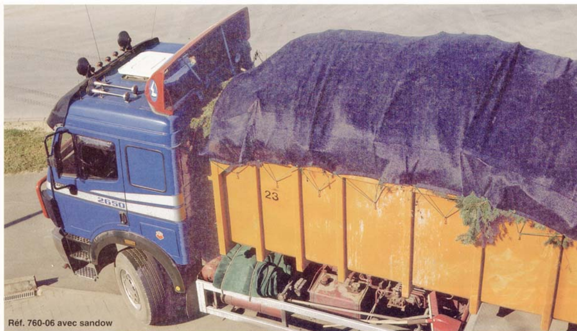
Réf. 760-06 avec sandow