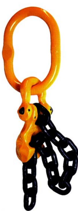
Avec une griffe de raccourcissement (GC/GCV).