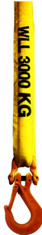
Avec un crochet simple à chape (CSC).