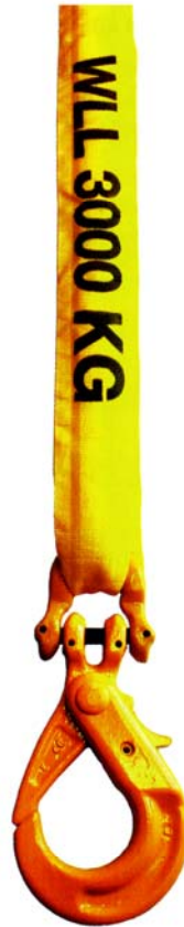
Avec un crochet à verrouillage à chape (XLC/GKC).