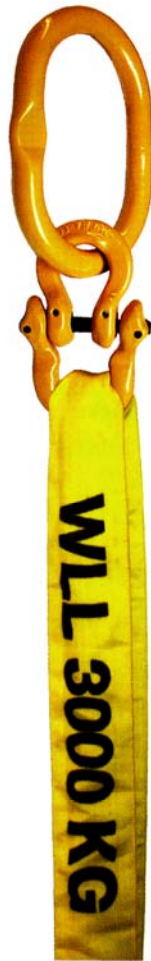
Avec un coupleur (CO).