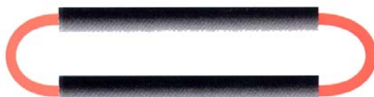
SUR 1 BRIN