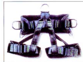
AG550 BAUDRIER ATLAS 1 point de suspension 2 points de maintien CE EN358 & EN813 & EN12277