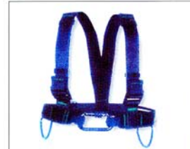
AG522 TORSE ATLAS Anneau thoracique & porte-accessoires CE EN12277