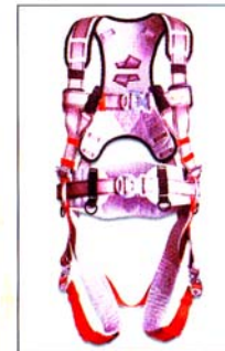
AB2006 HARNAIS SILVERBACK CONFORT 2 points d'ancrage antichute 2 points de maintien CE EN361 & EN358