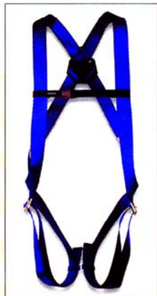
AB1000 HARNAIS FIRST 1 point d'ancrage antichute CE EN361.

Des produits simples et économiques pour une utilisation occasionnelle.