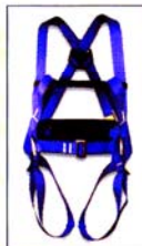
AB1000 + AB0400 HARNAIS + CEINTURE FIRST 1 point d'ancrage antichute 2 points de maintien CE EN361 & EN358