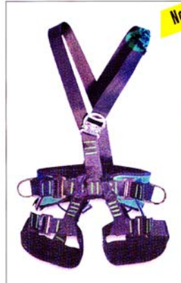
AG555 HARNAIS ATLAS "GRIMP" 1 point d'ancrage antichute 2 points de maintien 1 point de suspension central CE EN361 / EN358 / EN813