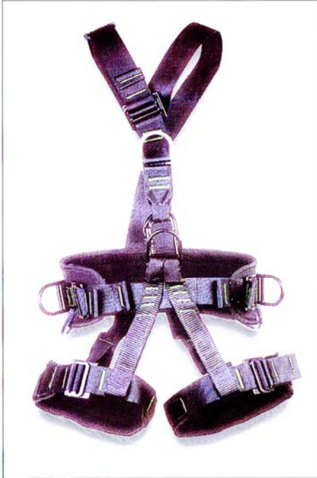
AG551 HARNAIS ATLAS 2 points d'ancrage antichute 2 points de maintien 1 point de suspension central CE EN361 / EN358

Travaux sur corde, accès difficiles ou missions de sauvetage, autant de situations délicates pour lesquelles les harnais ATLAS ont été rigoureusement conçus. Véritables outils de travail, ils sauront se faire oublier pour vous permettre de vous concentrer sur votre mission, sans avoir à vous soucier de votre sécurité.