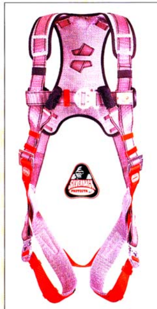
AB2003 HARNAIS SILVERBACK 2 points d'ancrage antichute CE EN361

Quand le confort est un critère déterminant dans le choix d'un harnais, Silverback est la réponse idéale. Conçu à partir de matériaux innovants, Silverback est doté de nombreux éléments de confort (capitonages anti-transpirant, boucles automatiques...) qui soulagent l'utilisateur pendant les interventions en hauteur de longue durée.