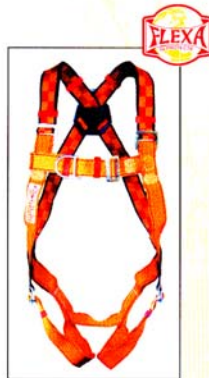
AB113E HARNAIS PRO FLEXA 2 points d'ancrage antichute CE EN361