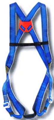
HT11 Harnais usage standard. • Conforme à la norme EN 361 • Accrochage dorsal « D forgé » • 2 points de réglage.