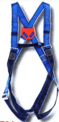
HT31 Harnais usage standard • Conforme à la norme EN 361 • Accrochage dorsal « D forgé » • 4 points de réglage *Options : Taille XL, CE, RL