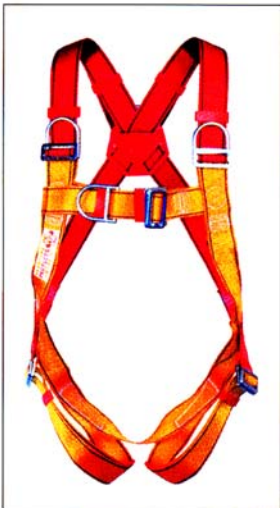
AB112 HARNAIS PRO 4 points d'ancrage antichute CE EN361