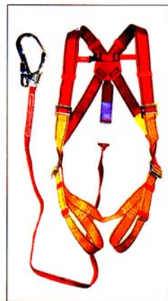
AB101/19 HARNAIS PRO "SCAFF" 1 point d'ancrage antichute longe antichute 2m CE EN361 & EN355