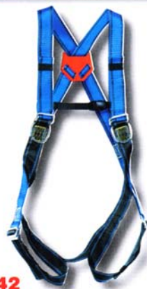
HT42 Harnais usages multiples • Conforme à la norme EN 361 • Accrochage dorsal et sternal «D forgé» • 4 points de réglage. *Options : Taille XL, CE, RL