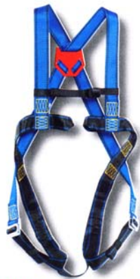
HT21 Harnais usages multiples. • Conforme à la norme EN 361 • Accrochage dorsal « D forgé », sternale boucles cousues • 2 points de réglage.