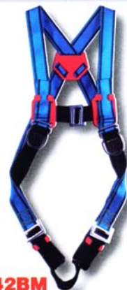
HT42BM Harnais usage standard • Conforme à la norme EN 361 • Accrochage dorsal et sternal «D forgé» • 4 points de réglage *Options : Taille XL, BM, CE