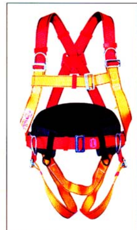
AB105 HARNAIS PRO 3 points d'ancrage antichute 2 points "D" de maintien CE EN361 & EN358