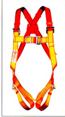
AB113 HARNAIS PRO 2 points d'ancrage antichute CE EN361