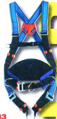
HT33 Harnais pour utilisation sur pylône et échelle. Conforme aux normes EN 358 et EN 361 . • Accrochage dorsal et ventral «D forgé» • Ceinture de maintien équipée de 2 «D forgé» • 4 points de réglages *Option : Taille XL et XXL, RL, BM