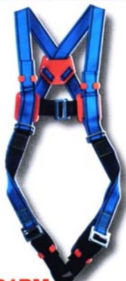
HT31BM Harnais usage standard • Conforme à la norme EN 361 • Accrochage dorsal « D forgé » • 4 points de réglage *Options : Taille XL, CE, RL