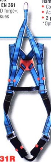
HT31R Harnais usage espaces confinés • Conforme à la norme EN 361 • Accrochage dorsal « D forgé » • 4 points de réglage *Options : Taille XL, CE, BM