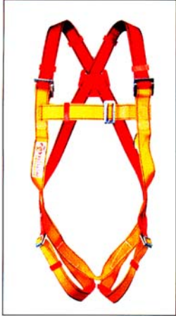
AB101 HARNAIS PRO 1 point d'ancrage antichute CE EN361

Des harnais spécialement conçus pour une utilisation technique et intensive au quotidien. Pensée pour vous offrir un niveau de sécurité maximum, la gamme PRO propose un vaste choix de harnais répondant au mieux à tous les environnements de travail.