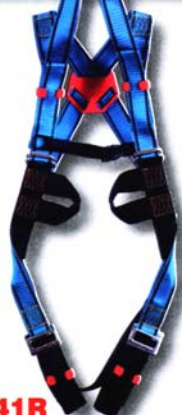
HT41R Harnais usages multiples • Conforme à la norme EN 361 • Accrochage dorsal « D forgé », sternale boucles cousues. • 4 points de réglage *Options : Taille XL, R, CE