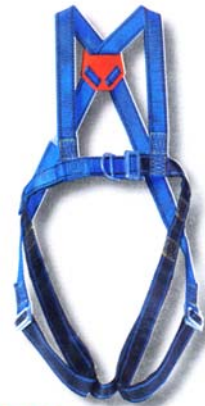
HT22 Harnais usages multiples. • Conforme à la norme EN 361 • Accrochage dorsal et sternal « D forgé » • 2 points de réglage. *Option taille XL