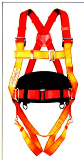
AB104 HARNAIS PRO 1 point d'ancrage antichute 2 points "D" de maintien CE EN361 & EN358