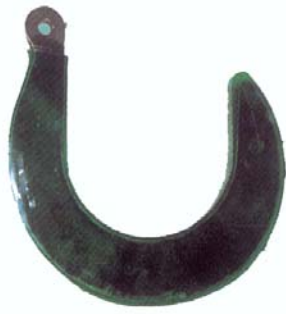
Enduction sur crochet à verrouillage à œil