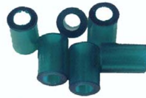
Bagues pour réalisation d'élingues câble perlées ALPU