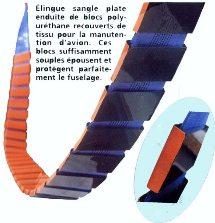
Élingue sangle plate enduite de blocs polyuréthane recouverts de tissu pour la manutention d'avion. Ces blocs suffisamment souples épousent et protègent parfaitement le fuselage.