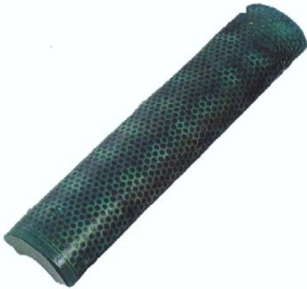
Moulage d'une plaque metal preformee servant de protection aux chocs ; cette realisation permettant aussi une excellente protection phonique.