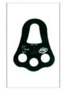
AG511 PLAQUETTE TRIPLE D'ANCRAGE résistance >25Kn CE EN795B