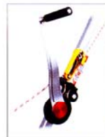
AG6800300B TREUIL D'ASSISTANCE ROLLGLISS AVEC POIGNÉE CE EN1496 CLASS B