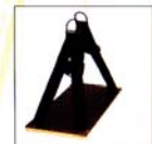
AG703 SELLETTE DE TRAVAIL - ATLAS