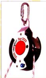
AG6350 R350 - ROLLGLISS SYSTÈME DE SAUVETAGE ET D'ÉVACUATION MODULAIRE CE EN341-1 CLASS A & EN1496 CLASS B