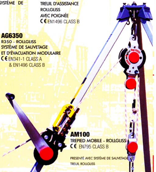
AM100 TREPIED MOBILE - ROLLGLISS CE EN795 CLASS B

PRESENTÉ AVEC SYSTÈME DE SAUVETAGE ET TREUIL ROLLGLISS