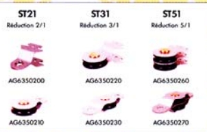
AG6350 - ST21 - ST31 - ST51 R350 ROLLGLISS AVEC SYSTÈME DE MOULAGE COMPLET